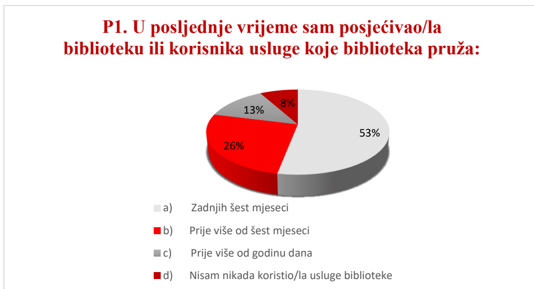
Grafikon 2. Rezultati ankete „Stepen zadovoljstva korisnika biblioteke“, pitanje 1.

Na pitanje u kojem su periodu koristili usluge ili posjećivali biblioteku studenti su u najvećem broju odgovorili u zadnjih šest mjeseci odnosno sa 53%. Njih 8% su rekli da nisu nikad koristili usluge biblioteke, 26% su koristili prije više od šest mjeseci, a 13% se izjasnilo da su koristili usluge prije više od godinu dana.