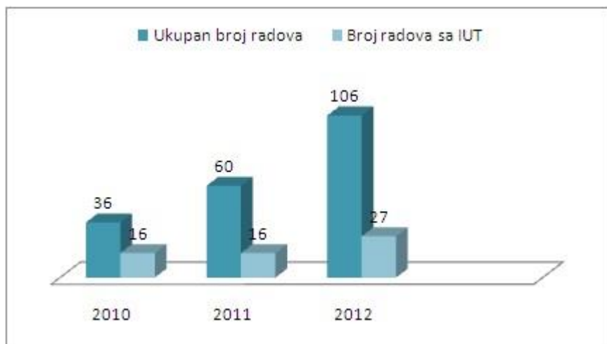
Grafikon 2. Ukupan broj radova na održanim savjetovanjima od 2010 do 2012. godine

Možemo zaključiti da se ukupan broj radova u 2012. godini povećao u odnosu na predhodne dvije godine a broj IUT radova se povećao za 9 radova.